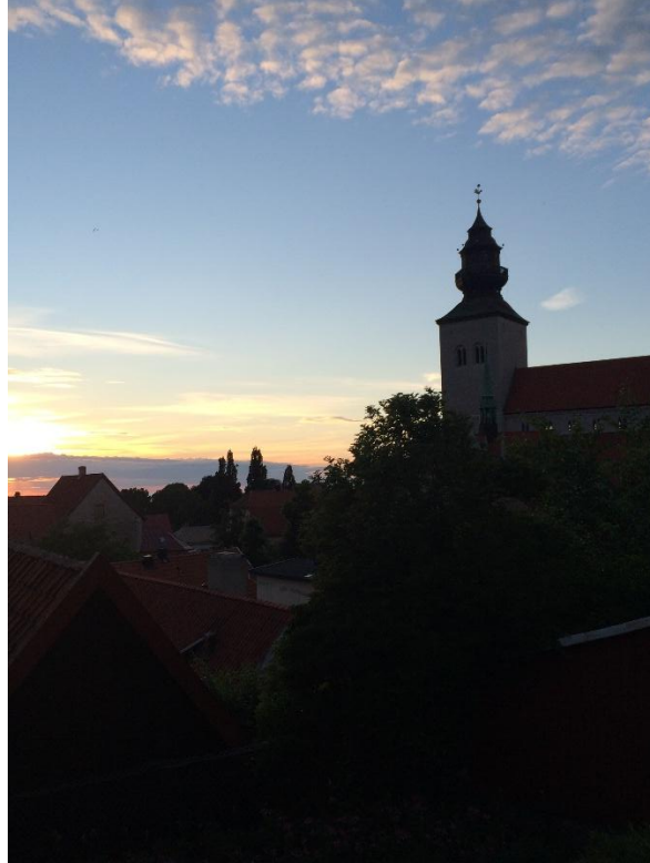
Juninatt i Visby